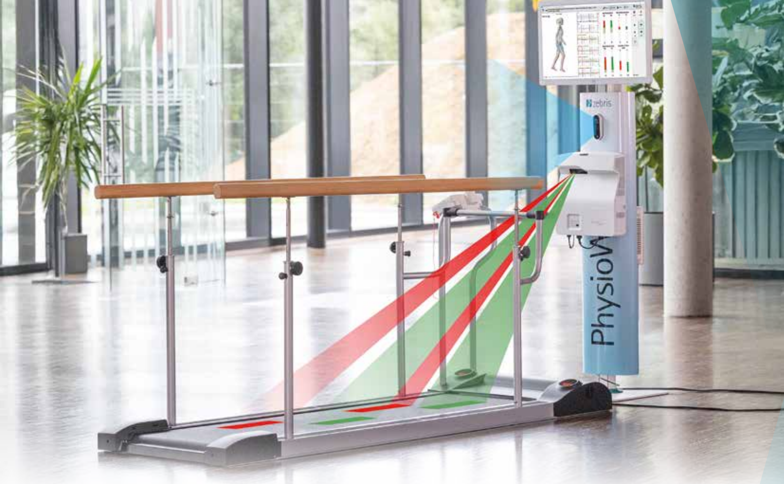
Gangtrainer PhysioWalk® 1.8 mit optionaler Stativeinheit mit 2D/3D-Kamera und Projektoreinheit