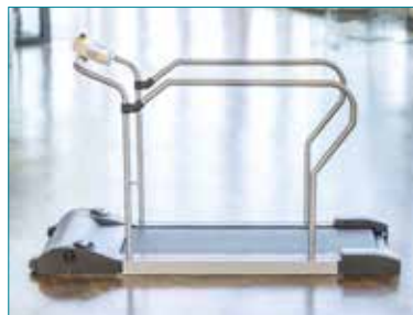
PhysioWalk® 1.0 und 1.2 Basic