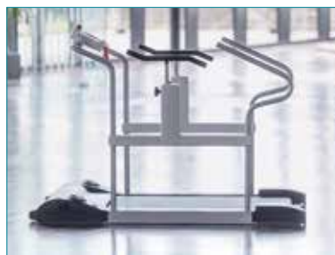
PhysioWalk® 1.0 Gehfläche 100 x 50 cm