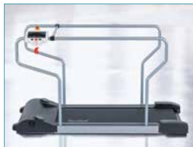
PhysioWalk® 1.2 Basic Side Panel