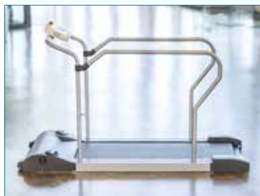
PhysioWalk® 1.0 und 1.2 Basic