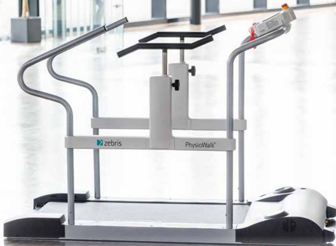
Gangtrainer PhysioWalk® 1.0 in der Grundversion